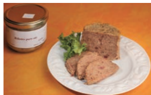
Rillettes pure oie