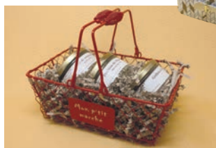
Foie gras d'oie entier

Notre ambition de producteurs fermiers est de vous faire partager les plaisirs simples de nos recettes traditionnelles. Avec l'oie, ce sera la fête à votre table !