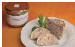
Galantine (60% foie gras)

Notre ambition de producteurs fermiers est de vous faire partager les plaisirs simples de nos recettes traditionnelles. Avec l'oie, ce sera la fête à votre table !