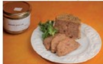
Rillettes pure oie