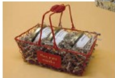
Foie gras d'oie entier

Notre ambition de producteurs fermiers est de vous faire partager les plaisirs simples de nos recettes traditionnelles. Avec l'oie, ce sera la fête à votre table !