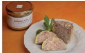
Galantine (60% foie gras)

Notre ambition de producteurs fermiers est de vous faire partager les plaisirs simples de nos recettes traditionnelles. Avec l'oie, ce sera la fête à votre table !